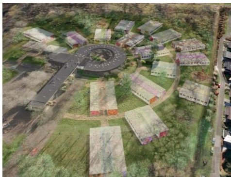
het AZC direct grenzend aan woningen